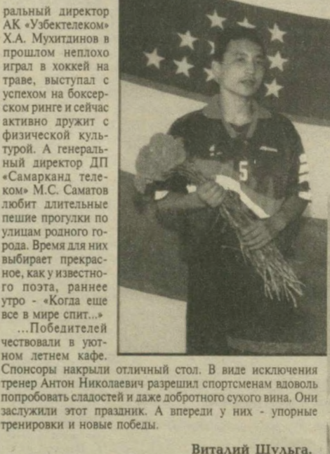
Самаркандская область. НА СНИМКАХ: фрагменты чествования чемпиона.

...Победителей чествовали в уютном летнем кафе. Спонсоры накрыли отличный стол. В виде исключения тренер Антон Николаевич разрешил спортсменам вдоволь попробовать сладостей и даже добротного сухого вина. Они заслужили этот праздник. А впереди у них - упорные тренировки и новые победы.