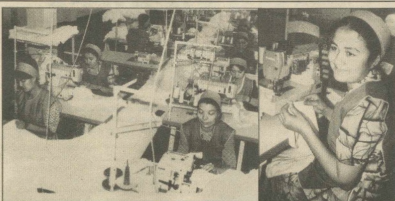
РЫНОК И ОТРАСЛЬ