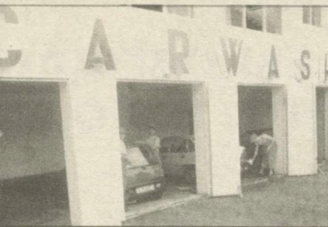
НА СНИМКАХ: новая автомойка; кафе «Великий шелковый путь» у автосалона; дилерская служба «УзДЭУавто».