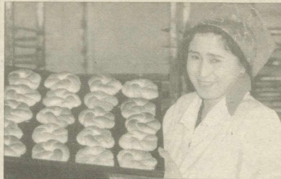
Акционерное общество № 1 Ферганского района выпускает хлебо- булочные изделия. Здесь ежемесячно производится до семи тонн высо- кокачественной продукции. Изделия получают не только коммерче- ские структуры. Готовую продукцию отправляют в детские сады, школьные и рабочие столовые. АО во всех кишлаках района органи- зовало 28 лепешечных цехов.

Известно, что 2002 год вошел в историю как Год защиты интере- сов старшего поколения. В резуль- тате реализации одноименной го- сударственной программы в на- шей стране была совершенствова- на система социальной защиты пожилых людей, ощутимо улуч- шилось их медицинское, санатор-