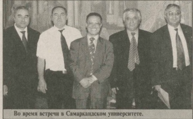
Во время встречи в Самаркандском университете.

щее положение в мировой системе образования. В настоящий момент этот университет является крупным центром науки по технологиям, фармацевтике, медицине и экономико-юридическим направлениям. Особую славу приобрели его исследовательско-образовательные центры, в частности, - Институт биотехнологии.