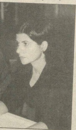
Беседу вела Назира Шабанова.

Сокращается ли число «новоселов» Узбекистана, вынужден избравших его своим новым местом жительства? Начиная с 1 мая 2002 года, представительство УВКБ ООН оказывает помощь афганским беженцам, которые добровольно приняли решение о возвращении на родину.