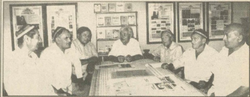
КАК ЖИВЕШЬ, МАХАЛЛЯ?

бумаги, основой для которой послужила целлюлоза Янгильской фабрики. Не сразу удалось добиться нужного качества, требуемой белизны. Специалистам пришлось изрядно повозиться... И вот он, результат, наличию. По качеству и дизайну тетради почти ничем не отличаются от зарубежных. Есть, конечно, мелкие шероховатости, но они поправимы. А вот по цене... По цене, как показывают предварительные расчеты, дешевле примерно на треть. Только представьте себе: на целую треть! Прикиньте это почти на сто миллионов тетрадей - таков годовой объем их выпуска. И какая экономия для тех семей, в которых учащиеся и студенты. С другой стороны, это и экономия валюты, которую «челноки» затрачивают на заграничные тетради.