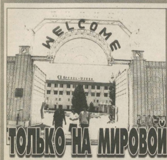
Совместные предприятия, построенные и введенные в строй с привлечением иностранных инвестиций, вносят немалый вклад в развитие нашей экономики, повышение благосостояния населения. Одним из них является узбекско-южнокорейское совместное предприятие «Кабул-Узбек-Текстайл».