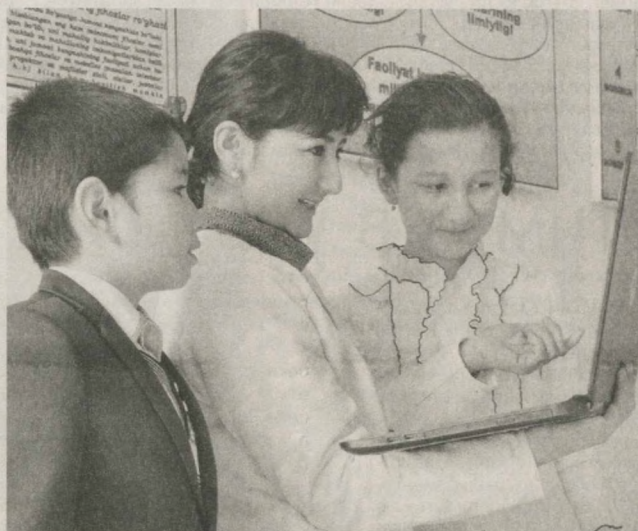
В общеобразовательной школе № 7 Фуркатского района Ферганской области созданы все условия для образования и воспитания молодежи.

Учебные кабинеты оснащены необходимыми принадлежностями, наглядными средствами. Ребята после занятий посещают научные, профессиональные и спортивные кружки. Работники школьного информационно-ресурсного центра уделяют особое внимание проведению праздников чтения, встреч с поэтами и писателями, в целом повышению культуры чтения молодежи. Ферганская область.