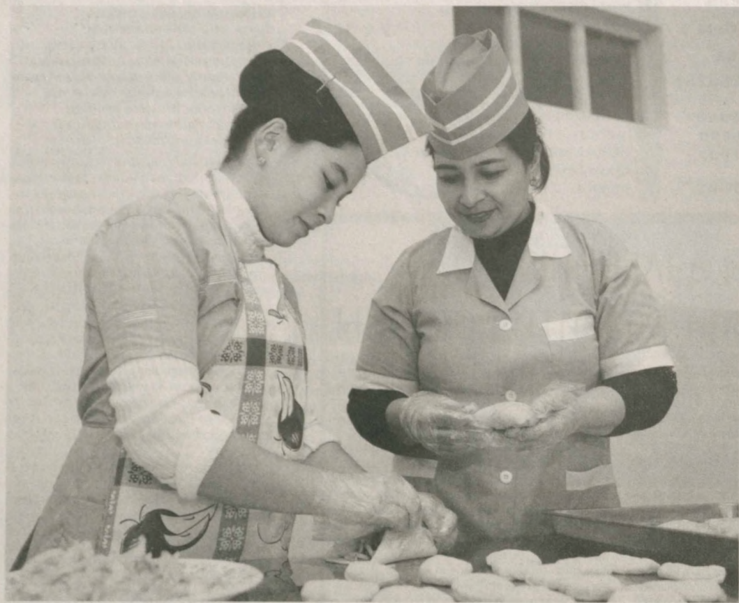
В колледже сервиса и предпринимательства Каршинского района готовят специалистов по восьми таким направлениям, как организация транспортных перевозок и управления транспортом, техник-технолог по производству швейной и швейно-трикотажной продукции, биржевой агент, обслуживание и монтаж автотранспортных средств.

Учащиеся по направлению кулинарии наряду с секретами приготовления блюд будут обучаться правилам сервировки стола, встрече гостей и их обслуживания. Учебно-практический кабинет оснащен современным инвентарем.