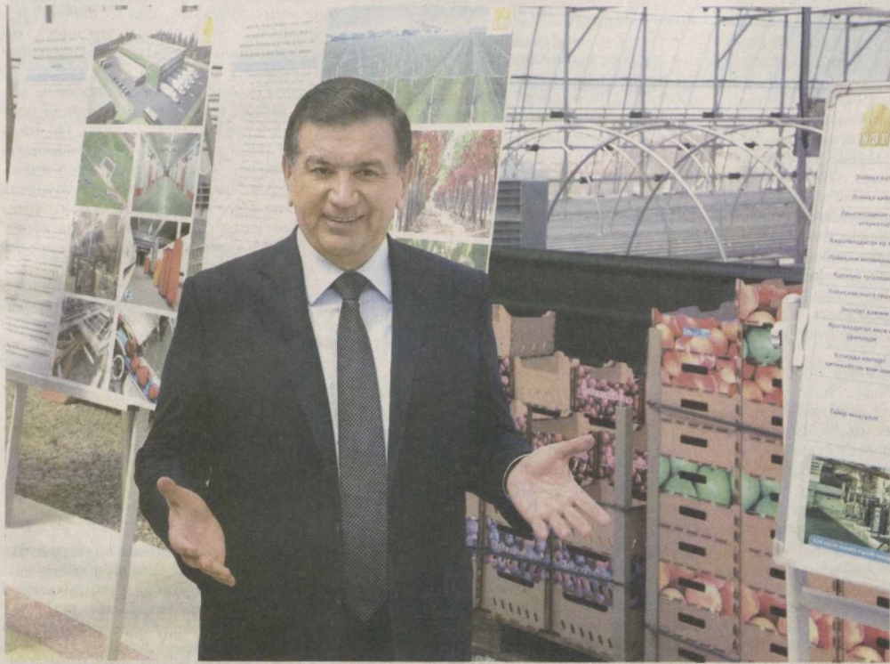
Президент Республики Узбекистан Шавкат Мирзиёев в целях ознакомления с осуществляемой созидательной и благоустроительной работой, ходом социально-экономических реформ на местах, диалога с народом 14 апреля прибыл в Самаркандскую область.

Самаркандская область благодаря своим развитым промышленным и сельскому хозяйству, богатым природным ресурсам, огромному туристическому потенциалу занимает важное место в экономической, социальной и культурной жизни нашей страны.