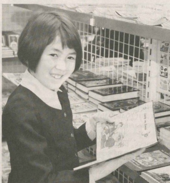
В нашей стране уделяется особое внимание повышению культуры чтения.

Распоряжение Президента нашей страны "О создании комиссии по развитию системы издания и распространения книжной продукции, повышению и пропаганде культуры чтения" от 12 января 2017 года служит важным фактором дальнейшего совершенствования этой работы. Книжный магазин общества с ограниченной ответственностью "Кашкадаре китоб олами" в Карши успешно удовлетворяет духовные потребности населения, приобретает подрастающее поколение к книге. Здесь реализуется художественная, научно-популярная, историческая, приключенческая и детская литература.