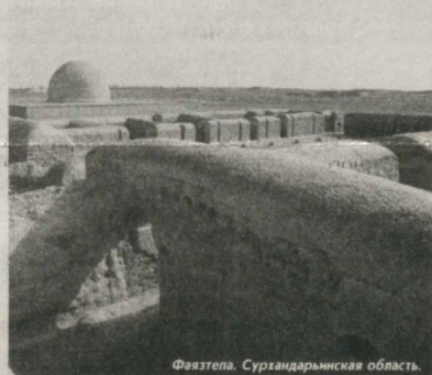
Феятепа. Сурхандарьинская область.

Дата, установленная Ассамблеей Международного совета по вопросам охраны памятников и достопримечательных мест (ICOMOS) при ЮНЕСКО, отмечается во всем мире вот уже более 30 лет. Празднуется она и в Узбекистане, который в 1991 году стал полноправным членом ООН, после чего многие исторические памятники были включены в Список Всемирного культурного наследия. Еще свыше 30 из них переданы в Комитет Всемирного наследия на предмет их включения в этот список.