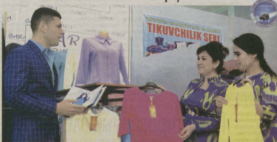
В Ургенте состоялась территориальная промышленная ярмарка и кооперационная биржа. Более 600 предприятий из Каракалпакстана, Самаркандской, Ташкентской и других областей представили широкий ассортимент отечественной продукции и изделий.