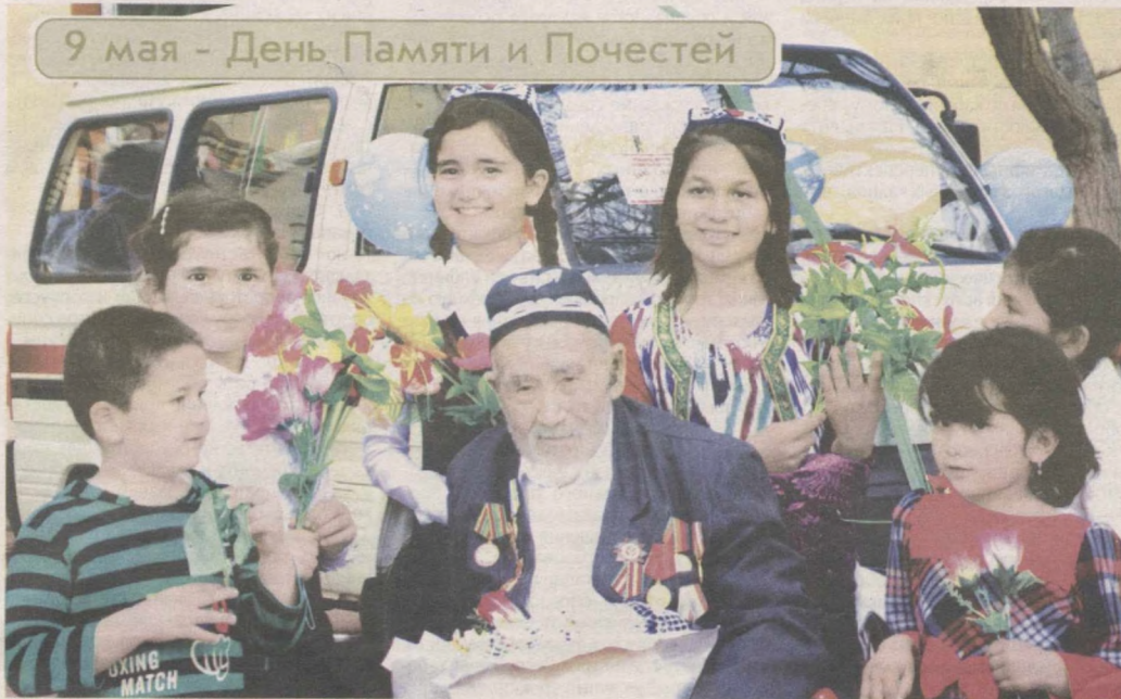
В Хорезмской области живут 85 ветеранов войны, а также более 2700 участников трудового фронта.

В соответствии с Указом Президента страны "О поощрении участников Второй мировой войны" и постановлением главы государства "О мерах по подготовке и проведению мероприятий, посвященных Дню Памяти и Почестей" от 4 апреля 2017 года в регионе идет соответствующая работа. Ветеранам 1941-1945 годов предусмотрена единовременная выплата в размере двух миллионов сумов. В эти дни ремонтируют-