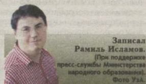
Записал Рамил Исламов. (При поддержке пресс-службы Министерства народного образования).

Как видно, обозначенные в Стратегии действий по дальнейшему развитию Республики Узбекистан задачи служат ведущим фактором модернизации системы народного образования. Их претворение в жизнь поможет нам вырастить всесторонне зрелое и гармоничное поколение, которое будет вести страну по пути прогресса, к покорению все новых вершин.