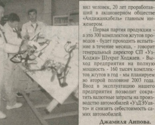
вил человек, 20 лет проработавший в акционерном обществе «Андижанкабель» главным инженером.