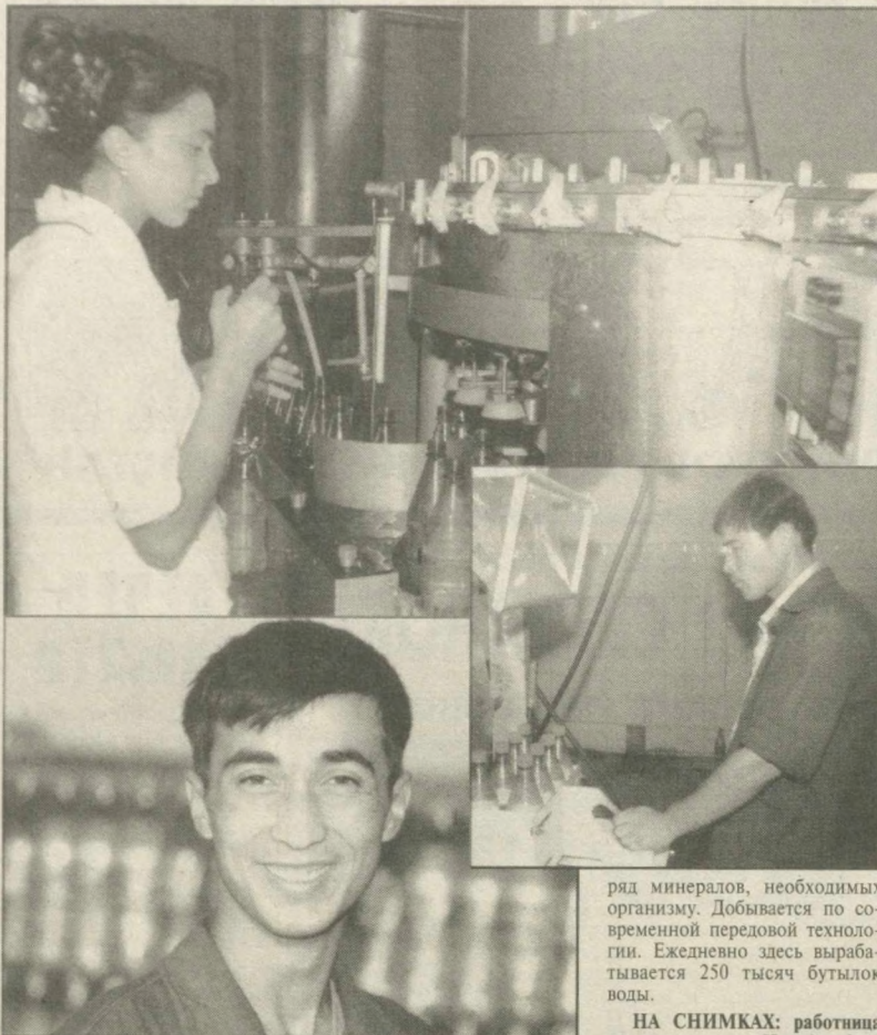
Совсем недавно начало свою деятельность предприятие «Alt Trading Corp - Tashkent» в Алтыарьском районе по производству минеральной воды, содержит ряд минералов, необходимых организму. Добывается по современной передовой технологии. Ежедневно здесь вырабатывается 250 тысяч бутылок воды.

Акрам Ташкенбаев. Корр. «Правды Востока», Сырдарьинская область.