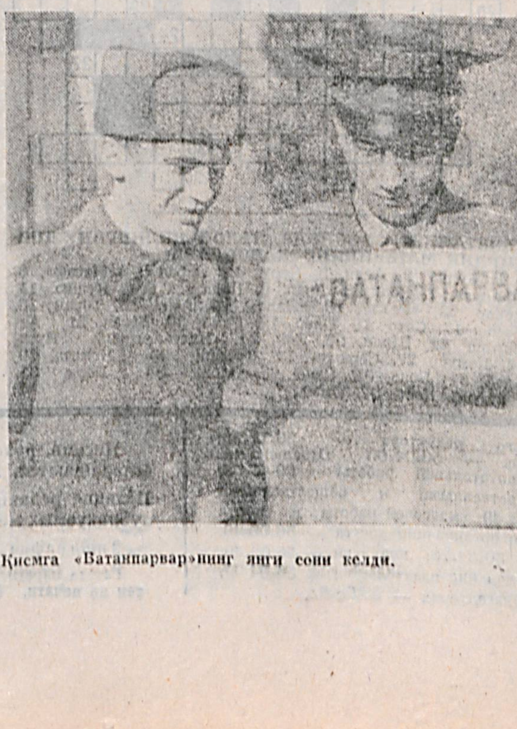
Қисмага «Батанпарварнинг йиқи сови келди»