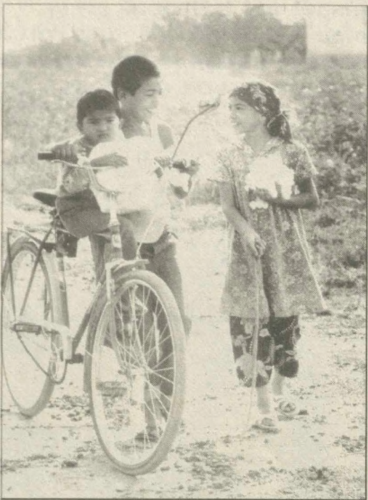
Встреча.