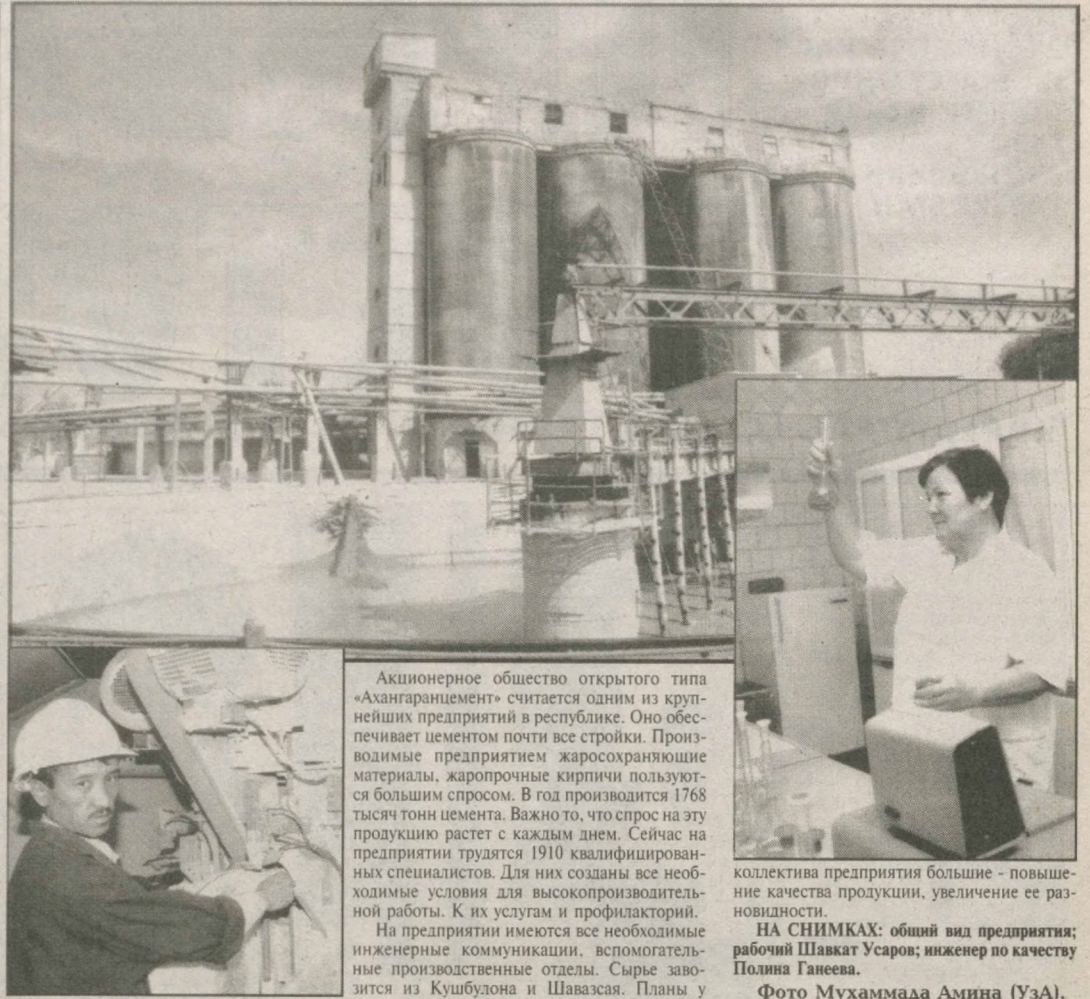
Акционерное общество открытого типа «Ахангаранцемент» считается одним из крупнейших предприятий в республике.

Напомним еще раз: подобная практика не сочетается с Указом Президента от 26 фев-