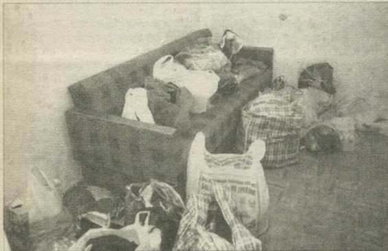
Эти образцы товаров, привезенные предпринимателями из-за пределов страны, могут лежать без движения не один день.