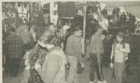
Торговые ряды рынка АО «Чорсу буюм бозори» активно насыщаются товарами народного потребления.

Это СП, созданное еще в 1997 году и учредителями которого являются Госстандарт и его Институт повышения квалификации кадров, выдает сертификат-соответствие для товаров народного потребления, завозимых из-за рубежа, а также производимых в нашей стране. СП небольшое, всего-то там экспертов чуть больше десятка. И, конечно, нахлынувший на них поток желающих получить срочный сертификат обрушился, как снег на голову. В связи с этим, к выявлению качества поступающей на сертификацию продукции подключены химические лаборатории крупнейшей текстильной и трикотажной предприятий - «Малки», Ташкентского текстильного комбината и других. Лаборатории этих производств располагают всем необходимым для определения качества товаров народного потребления. Кроме того, сегодня