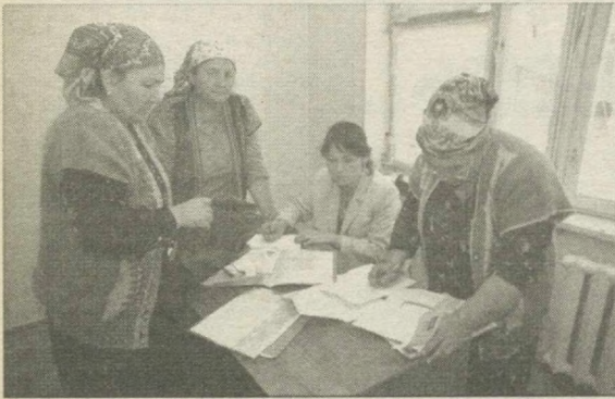
Ташкент, улица Чопоната, 9 «В». Этот адрес хорошо известен многим предпринимателям. Здесь разместились орган по сертификации товаров народного потребления. Вот так в тесной комнатке, где один стул, приходится заполнять документы на получение сертификата соответствия.