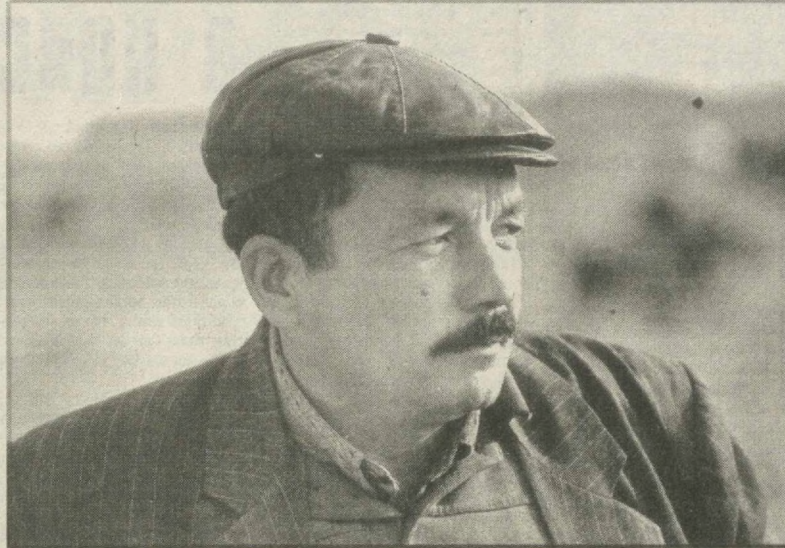
Племенное каракулевое ширкатное хозяйство «Муборак» занимает особое место в Муборакском районе. Это специализированное хозяйство имеет большую опытную базу по уходу за каракульскими овцами.

В уходящем году пополнился список промышленных предприятий Хорезма. Вступило в строй «Урганч бахмали», которое с освоением производственной мощности ежегодно будет выпускать 600 тысяч погонных метров пользующихся спросом у населения велюра, шелка и другой ткани. Сырьем для дорожных материалов служат местные шелк, хлопковая пряжа и пока завозимая из России вискоза.