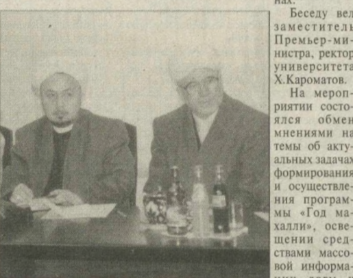
Президента Ислама Каримова 2003 года Годом махалли явилось логическим продолжением этого благородного дела.

Велика роль махалли в жизни нашего народа. С момента рождения и на протяжении всей своей жизни человек формируется в этой среде, растет, воспитывается.