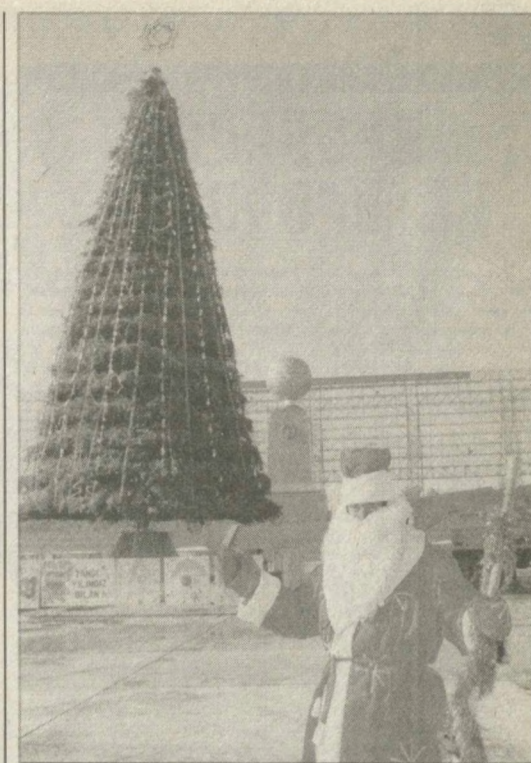
Вот и наступает долгожданный, всеми любимый праздник - Новый год! Город украшен красавицами-елками, подготовлены подарки.