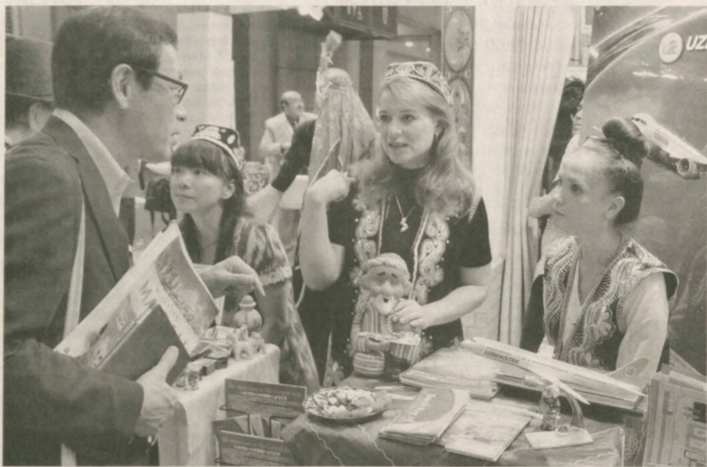
НАК "Узбекистон хаво йуллари" презентовала свои услуги на Международной туристической выставке "JATA Tourism EXPO Japan-2015" в Японии.

Возможности НАК "Узбекистон хаво йуллари" по авиаперевозкам представили на едином масштабном национальном стенде Узбекистана, где также презентовали услуги туристических компаний, агентств и ведущих туроператоров нашей страны. На нем развернули обширную экспозицию изделий народно-прикладного искусства, сувенирной продукции, вниманию посетителей предложили информационные каталоги и брошюры, видеofilмы, раскрывающие красоту и привлекательность Узбекистана как страны мирового туристического направления. Большое количество посетителей стенда Узбекистана наглядно