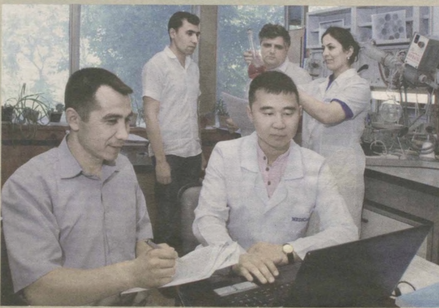
Кажется, целого дня мало, чтобы пройтись по всем лабораториям Научно-исследовательского центра химии и физики полимеров при Национальном университете Узбекистана имени Мирзо Улугбека, а уж понять принципы их работы - на это и всей жизни не хватит. Такое ощущение складывается поначалу, когда попадешь на территорию ученых, создающих будущее нашей страны.

Испытания, проходившие во всех регионах республики, порадовали ученых и фермеров положительными результатами. Отечественный продукт на деле доказал свою эффективность и рентабельность, что заметили многие специалисты отрасли, и на последней VIII Республиканской ярмарке инновационных идей, технологий и проектов центр заключил договоры более чем на 300 млн сумов.