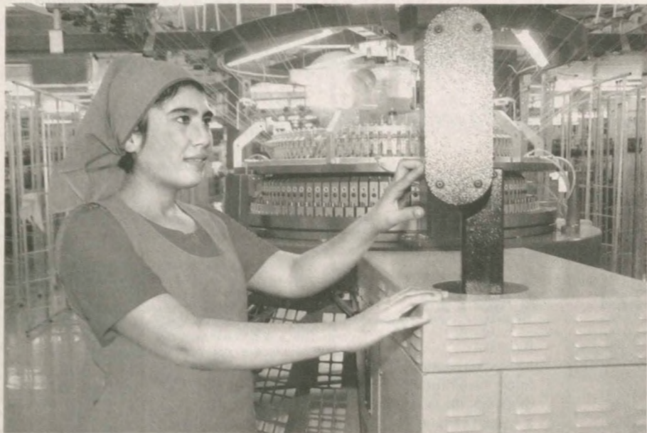
На совместном узбекско-британском предприятии "Пластикс" Джизака за год перерабатывают более 13 тысяч тонн хлопковолокна и производят пряжу и готовую ткань.