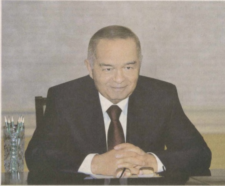
Президент Республики Узбекистан Ислам Каримов 5 ноября в резиденции Оксарой принял первого заместителя министра промышленности, торговли и природных ресурсов Республики Корея Ли Хван Сопу.

Глава нашего государства отметил, что Южная Корея является одним из ключевых инвестиционных и технологических партнеров Узбекистана. При активном участии южнокорейского бизнеса реализуется ряд стратегических проектов в различных отраслях экономики нашей страны. Яр-