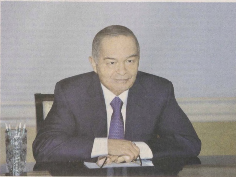
Президент Республики Узбекистан Ислам Каримов 10 ноября в резиденции Оксарой принял президента нефтяной компании "ЛУКОЙЛ" Вагита Алекперова.

Приветствуя гостя, глава нашего государства отметил активную деятельность этой компании по реализации совместных проектов в нефтегазовом секторе Узбекистана.