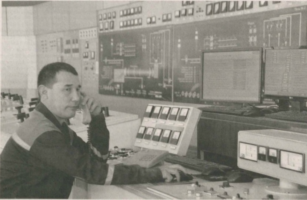
Общество с ограниченной ответственностью "Qizilqumsetmet" является одним из крупнейших предприятий нашей страны по производству строительных материалов.

Кроме качественных цементных изделий, на заводе