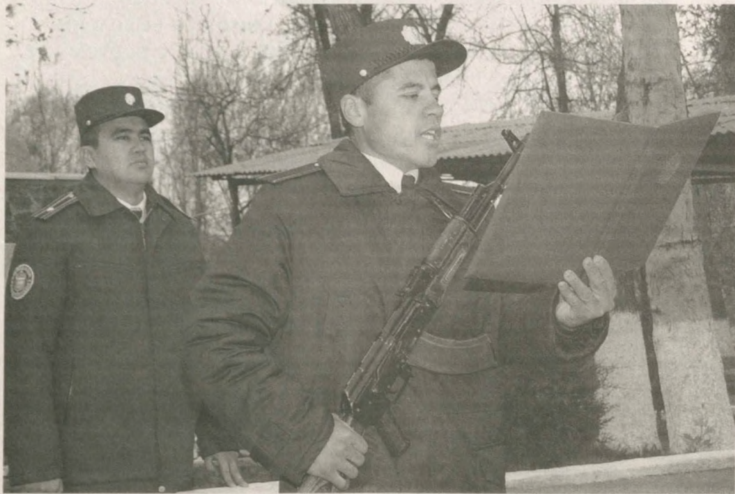
На учебном полигоне Академии МВД Республики Узбекистан прошло торжественное мероприятие, посвященное принятию присяги на верность Родине курсантами высших курсов по подготовке сержантского состава.