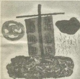
ЗЕМЛЯ НАШ ОБЩИЙ ДОМ

Совместный проект «Правды Востока» и Ташкентского инфоцентра «Среда обитания».