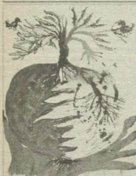
Рисунки студии «МИМ».