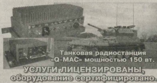
Танковая радиостанция «Q-MAC» мощностью 150 Вт. УСЛУГИ ЛИЦЕНЗИРОВАНЫ, оборудование сертифицировано.

Адрес: 100100, г.Ташкент, ул. Ш. Руставели, д. 60, кв. 1. Тел./факс: (99871) 253-02-76, 253-31-76. E-mail: kvant@tps.uz