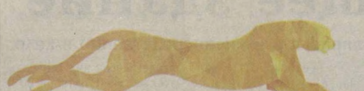
ТАШКЕНТСКИЙ МЕЖДУНАРОДНЫЙ КИНОФОРУМ "ЗОЛОТОЙ ГЕПАРД"

В праздничном убранстве кинозал Дворца творчества молодежи, сцена украшена баннерами с изображением "Золотого гепарда". Считанные минуты остались до долгожданного события - открытия первого в истории независимого Узбекистана Ташкентского международного кинофорума.