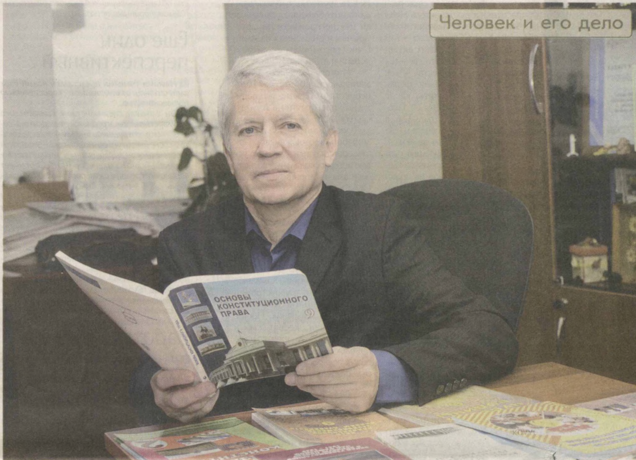
Человек и его дело