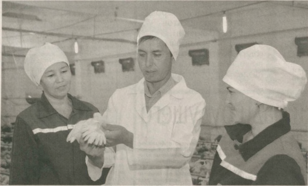
■ Начавшая действовать во второй половине этого года птицеводческая ферма Центрального горно-рудачного управления Навоийского горно-металлургического комбината в короткие сроки стала поставлять на потребительский рынок более тридцати тонн диетического мяса.

В настоящее время здесь откармливают 18 тысяч цыплят. Большинство из тридцати работников - выпускники