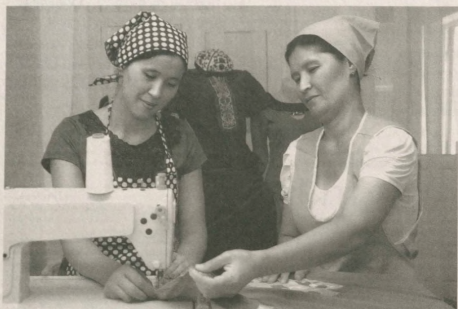
ООО "Zar Dil Dilbar", осуществляющее свою деятельность в городе Нукус Республики Каракалпакстан, изготавливает одеяла, покрывала и специальную одежду.

Все более увеличивается количество заказов на продукцию предприятия, на котором трудятся свыше