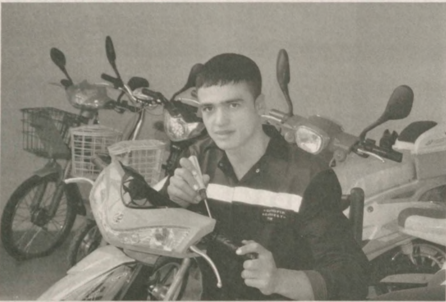
В 2015 году за счет инвестиций в объеме 150 тысяч долларов создано общество с ограниченной ответственностью "Кушкуниртехноинвест", специализирующееся на производстве электровелосипедов.

К настоящему времени в магазины отправлено 200 электровелосипедов, оснащенных современными аккумуляторными батареями.