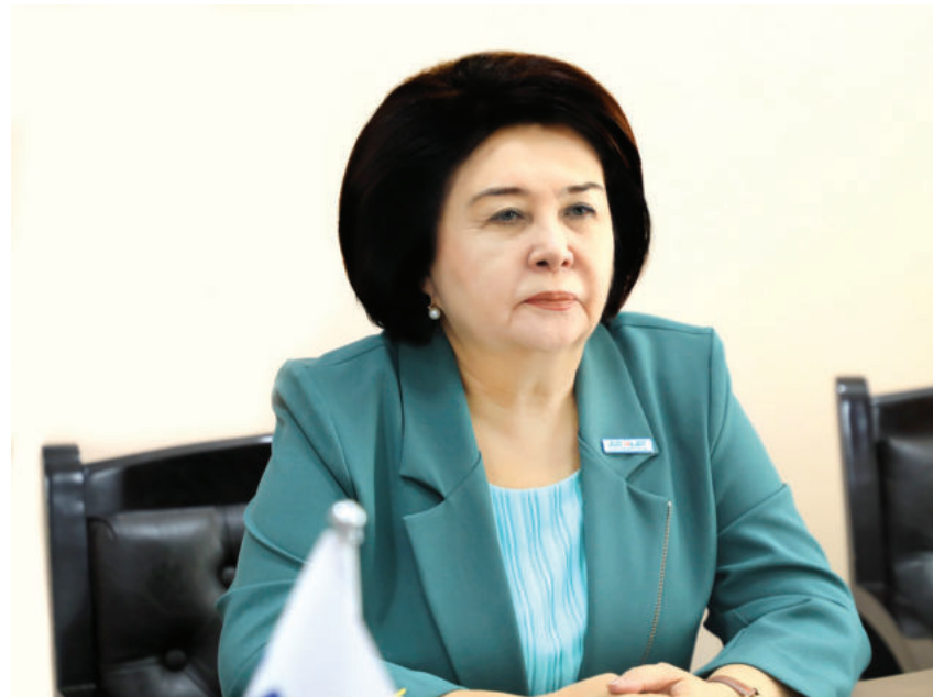
Робахон МАХМУДОВА, Ўзбекистон "Адолат" СДП Сиёсий Кенгаши раиси