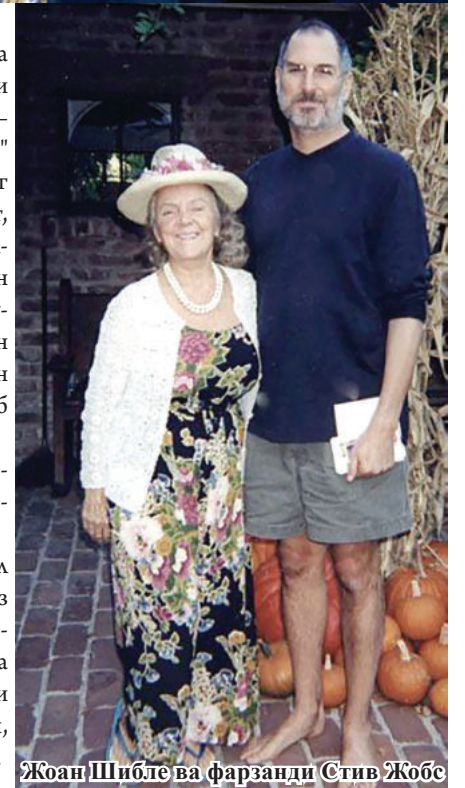
Жоан Шибле ва фарзанди Стив Жобс