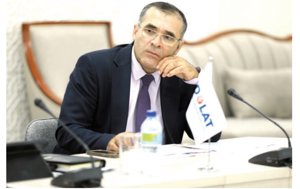
Қодир ЖҰРАЕВ, Олий Мажлис Қонунчилик палатаси Халқаро ишлар ва парламентлараро алоқалар қўмитаси раисининг ўринбосари

1 Айниқса, 2016 йилдан икки мамлакат ўртасидаги муносабатларнинг янги юксалиш даври бошланди десак, асло муболаға бўлмайди. Бунга икки давлат етакчилари ўртасидаги юқори даражадаги тўғридан-тўғри ва самарали мулоқотлар ҳам яқиндан ёрдам бериб келмоқда.