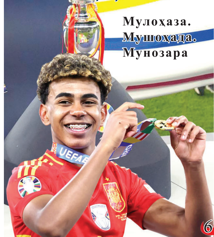
Мулоҳаза. Мушоҳада. Мунозара