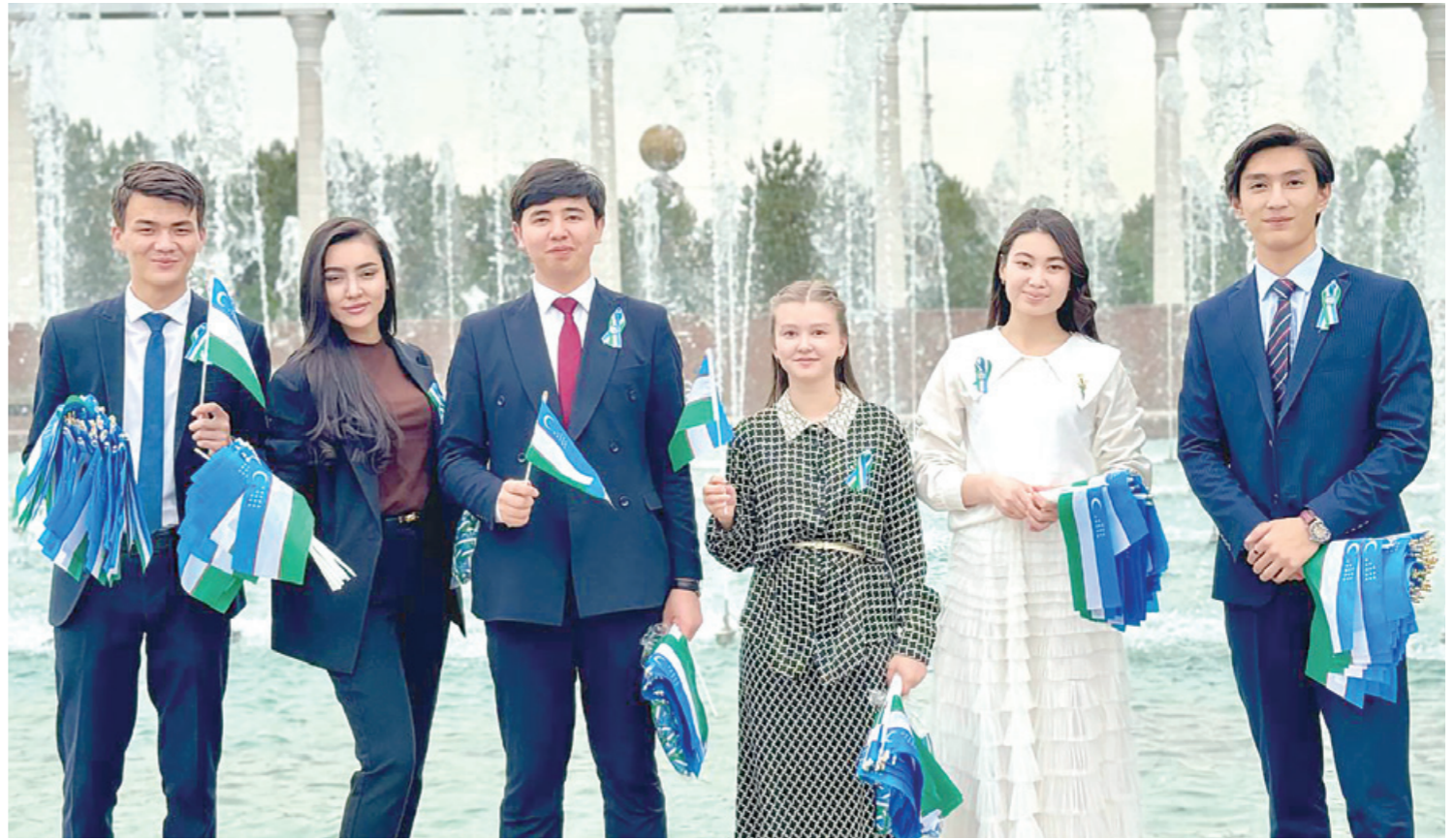
Иқтидорли ёшларни излаб топшиш, истеъдодини рўёбга чиқариш ва уларни қўллаб-қувватлашга кўмаклашинг. Жумладан, иқтидорли ёшларнинг рўйхатини шакллантиринг, муаммо ва тақлифларини эшитиб, амалий ёрдам беринг.

Президентимизнинг Ёшларга ер ажратиш орқали уларнинг даромадларини оши-