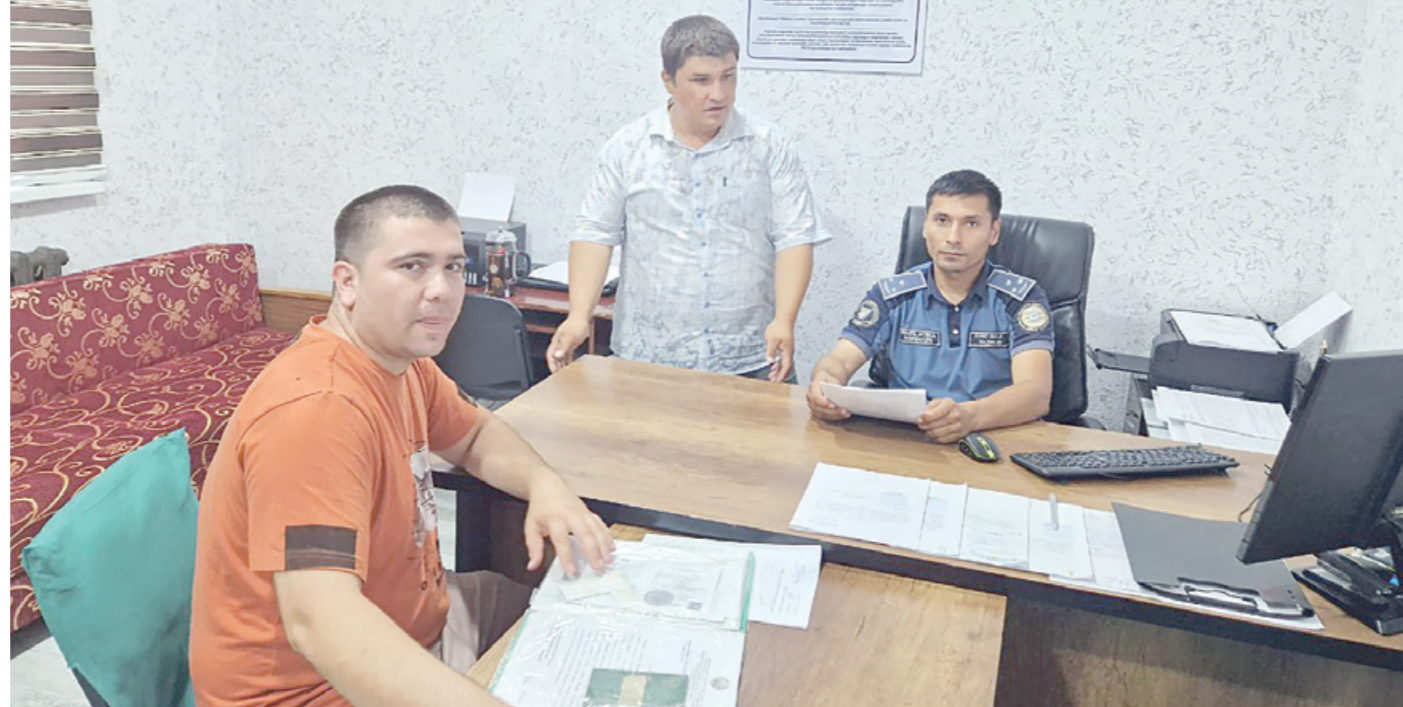
Жорий йил ҳисобида безорилик, оила турмуш жиноятлари умуман қайд этилмади. Спиртли ичимликка ружу қўйган 9 нафар фуқаро тўғри йўлга қайтди.

Фуқаролар турмуш тарзини ўрганиб, нотинч оилалар, низоли қўшинлар, жиноятчиликка мойиллиги бор, илгари судланганлар билан профилактик суҳбатлар ўтказаман. Аниқланган масалалар ечим бўйича “маҳалла еттилик” ҳамкорлигида иш олиб бораемиз. Мурувватларни ўз вақтида қўриб чиқиш, ҳал этиш чораларини кўряман. “Тўқимачи” маҳалласида бир йил олдин иш бошлаганимда ҳудуд “қизил” тоифада эди. Маҳалла ҳудудида иккита йирик бозор, шаҳар бўйлаб 6 та йўналишда ҳаракатланадиган автобус ва йўналишли транспортлар учун автошоҳбехат, истироҳат боғи бор. Айнан ушбу ҳудудларда ўғрилиқ, безорилик жиноятлари кўп қайд этилган. Шу боис дастлаб аҳолининг ҳуқуқий саводхонлигини ошириш бўйича тарғибот тадбирлари ўтказдик.