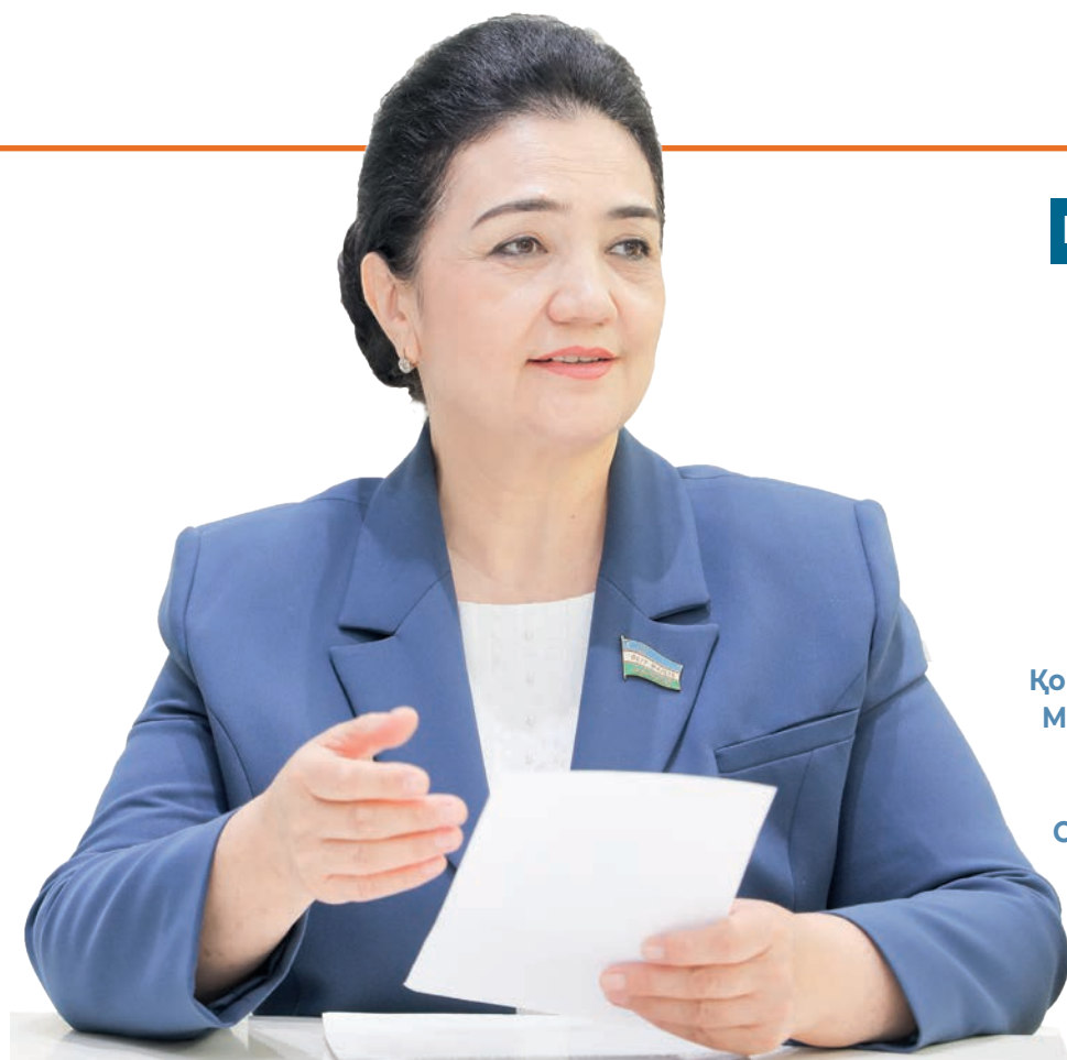
Мавлуда ХЎЖАЕВА, Олий Мажлис Қонунчилик палатаси Меҳнат ва ижтимоий масалалар қўмитаси раиси, O'zLiDeP фракцияси аъзоси