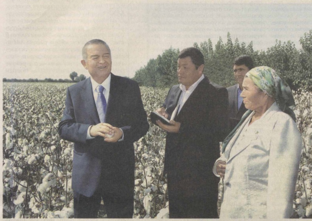
Президент Республики Узбекистан Ислам Каримов в целях ознакомления с ходом осуществляемых на местах социально-экономических реформ, созидательной работой 6 октября посетил Андижанскую область.

Андижанская область занимает особое место в развитии экономики нашей страны. Промышленность и сельское хозяйство, труд самоотверженных людей служат важным фактором последовательного углубления реформирования во всех сферах. Коренным образом меняется и преобразуется облик областного центра, городов и сел, повышается уровень жизни населения. Осуществляется последовательный процесс развития современных промышленных отраслей, строительства новых предприятий и модернизации действующих мощностей. В рамках Программы социально-экономического развития области на 2013-2015 годы с начала года реализовано 2815 проектов общей стоимостью 253 миллиарда сумов, создано более 24 тысяч новых рабочих мест. В результате широкой поддержки