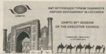
ВМТ ВУТУЖАХОН ТУРИЗМ ТАШКЕНТИ ИЖРОИ КЕЛГАШИНИНГ 99-СЕССИЯСИ

- 99-я сессия Исполнительного совета ЮНВТО прошла чрезвычайно успешно. Впечатлена выступлением Президента Ислама Каримова. Заслуживает внимания то, что в Узбекистане сфера национальных ремесел полностью освобождена от налогов. Уделяемое в нашей стране большое внимание стимулированию национального ремесленничества способ-