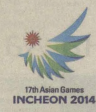
17th Asian Games INCHEON 2014

На основании представленных документов Центральная избирательная комиссия в установленный законом срок примет окончательное решение о допуске партии к участию в выборах.