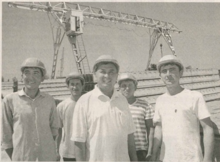
Согласно Программе развития промышленного потенциала Ташкентской области на 2013-2015 годы, утвержденной постановлением Президента страны, для обеспечения стабильного развития промышленности в регионе создаются высокотехнологичные предприятия.

ООО "VERSAL INVEST PLUYS" из Аккурганского района специализируется на изготовлении железобетонных плит. Здесь с каждым