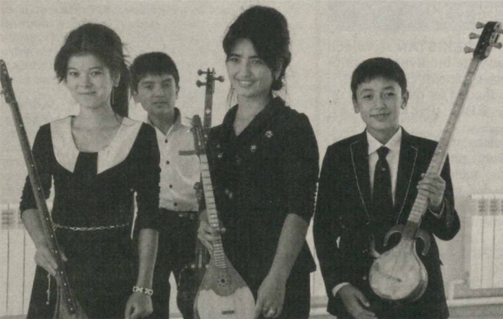
В Бешарыкском районе Ферганской области свои двери открыла школа музыки и искусства №18. К занятиям приступили более 150 мальчиков и девочек.

Школа, построенная по современному проекту, соответствует всем требованиям по эффективной организации образовательного процесса по направлениям: национальные инструменты, фортепиано, ударные и духовые, танцевальное, прикладное и изобразительное искусство, эстрадное и традиционное пение. Открылись концертный и танцевальный залы. К услугам учащихся новые музыкальные инструменты.