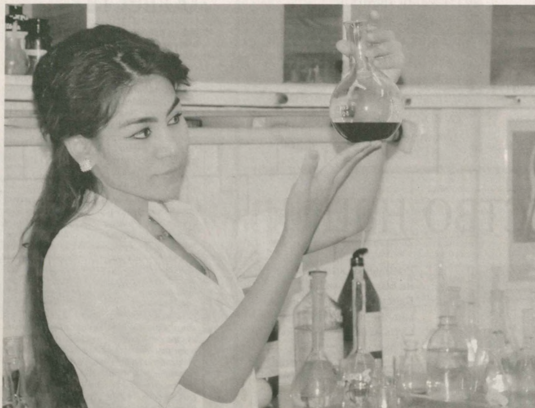
Продукция, производимая АО "Фаргоназот", входящим в состав ГАК "Узкимсаноат", экспортируется в десятки зарубежных стран.

На территории завода, специализирующегося на выпуске минеральных удобрений, функционируют 24 цеха. В них трудятся более семи с половиной тысяч человек - настоящих профессионалов своего дела. Благодаря техническому и технологическому обновле-