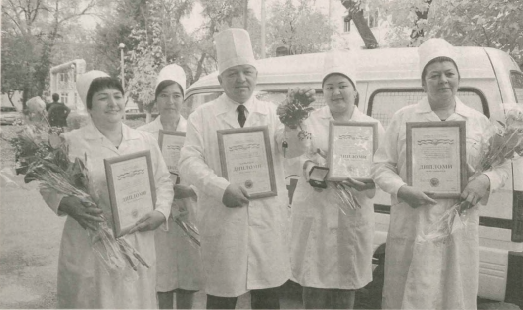
В Ташкентском институте усовершенствования врачей состоялось торжественное награждение специалистов, приуроченное к Дню медицинских работников Республики Узбекистан.

Выступившие министр здравоохранения А.Алимов и другие отметили, что благодаря реформированию медицинской отрасли, осуществляемому по инициативе Президента Узбекистана, создаются качественно новые условия для развития сферы. В рамках Государственной программы "Год здорового ребенка" выполняются намеченные цели по воспитанию гармонично развитого, физически крепкого молодого поколения. Так, из бюджета выделены средства в размере 382,4 млрд сумов для запуска 137 современных медицинских учреждений, осуществлена капитальная реконструкция различных специализированных заведений по всей стране, среди которых детские многопрофильные медицинские центры Ташкентской, Самаркандской, Бухарской, Анджанской, Кашкардывинской областей. На основе концепции "Здоровая мать - здоровый ребенок" в регионах республики работают скрининговые и перинатальные центры. Подчеркивалось, что проведение иммунизации населения, а также пропаганда здорового образа жизни способствовали снижению показателей инфекционных заболеваний. Вместе с тем намечено продолжение работы по развитию медицинской сферы в соответствии с постановлением главы государства "О Государственной программе по дальнейшему укреплению репродуктивного здоровья населения, охране здоровья матерей, детей и подростков в Узбекистане на период 2014-2018 годы" от 1 августа этого года.