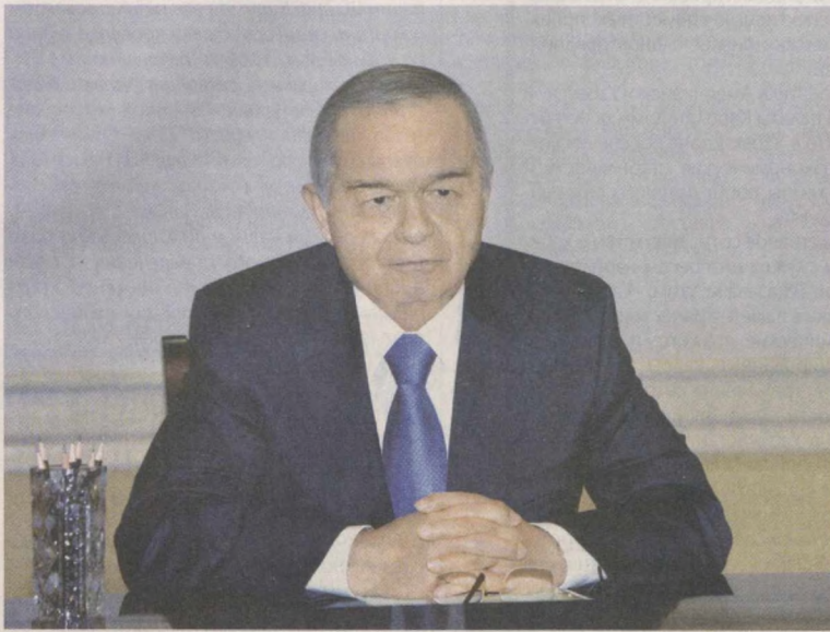
Президент Республики Узбекистан Ислам Каримов 11 ноября в резиденции Оксарой принял Председателя Американско-Узбекской торговой палаты (АУТП) Кэролин Лэм, прибывшую в нашу страну для участия в очередном заседании АУТП.

Нынешний визит в Узбекистан делегации представителей ведущих компаний и фирм США является свидетельством растущего интереса американского бизнеса к Узбекистану, стремления к дальнейшему расширению двустороннего торгово-экономического и инвестиционного сотрудничества.