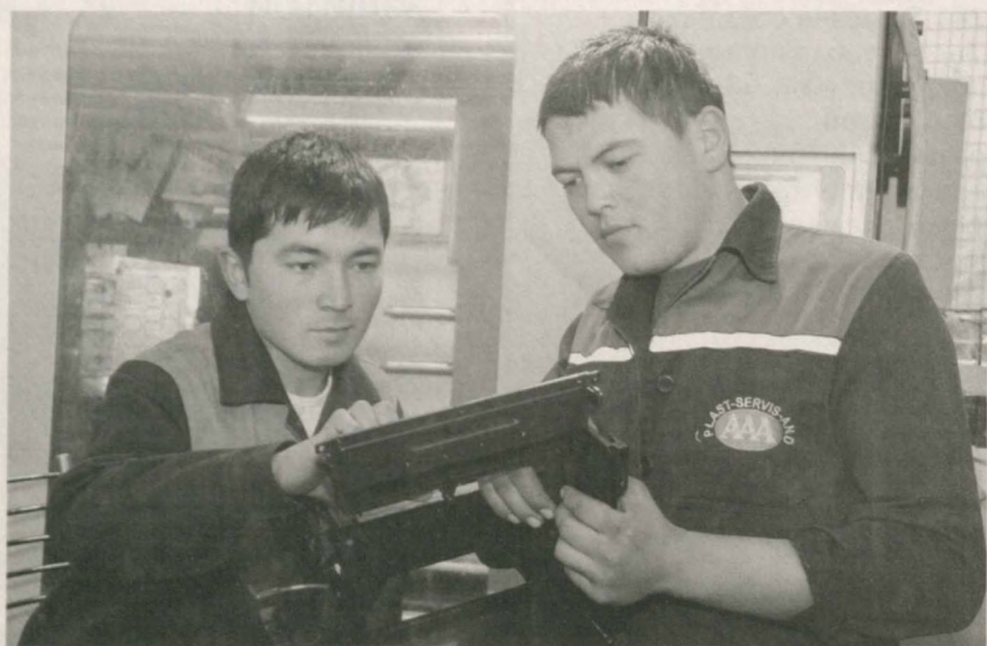
Все больше отечественных предприятий поставляет комплектующие одному из крупнейших производителей автомобильной техники страны - совместному предприятию "GM Uzbekistan".

В их число входит и частное предприятие "Plast servis and" в Андижанском районе, созданное не так давно, но уже добившееся весомых результатов. Здесь изготавливают более пятидесяти видов деталей из пластмассы для автомобилей марок "Lacetti", "Nexia", "Spark" и других.