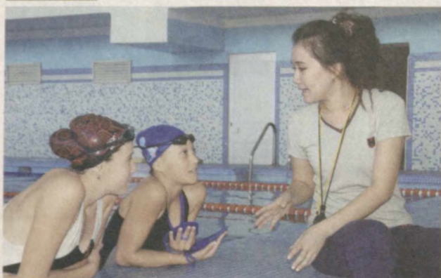
Эффективно и плодотворно проходят тренировки в недавно реконструированной спортивной школе олимпийского резерва Ферганской области, которые проводит тренер Азиза Рахимова.