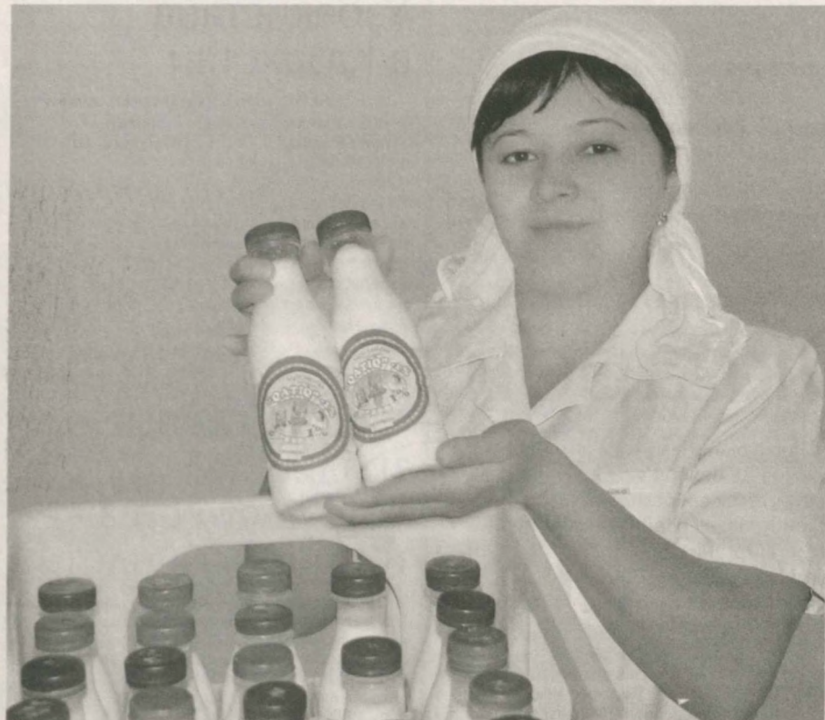
■ Частная фирма "Наврзукомиссонгуштарилсавадо" города Навои производит десять видов молочной продукции, в том числе кефир, сметану, творог, сыр, йогурт. Изготовленную на основе современных технологий продукцию доставляют населению го-

рода, на предприятия и в организации. В настоящее время на предприятии строится цех по переработке мяса, который будет сдан в конце этого года.