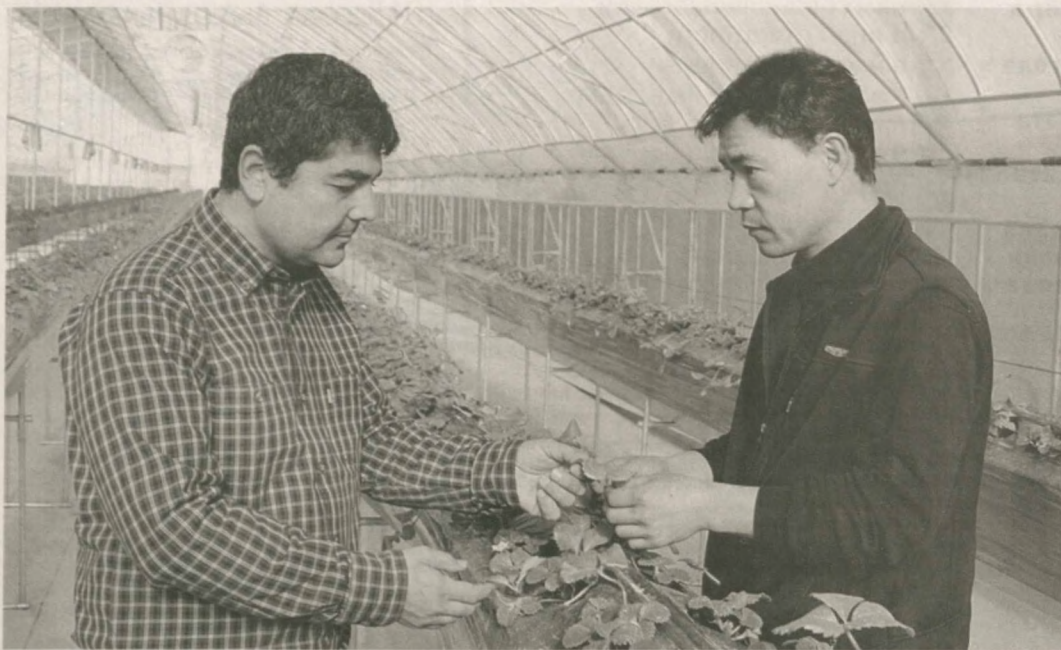
В Джамбайском районе Самаркандской области начала функционировать современная теплица, построенная узбекско-корейским СП "KUTE", где по интенсивной технологии выращивают клубнику.