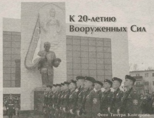
К 20-летию Вооруженных Сил

Благодаря поэтапной реализации глубоко продуманной руководством страны долгосрочной комплексной программы реформирования и модернизации Вооруженных Сил они стали школой мужества и отваги для молодежи, воспитания ее в духе преданности Родине и народу.