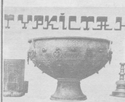
шақл-шамойили ва улугворлиги билан сақлаб қолишга бутун куч-ғайратларини сафарбар қилдилар. Айни кунларда амалга ошириляётган таъмирлаш ишлари ҳам бундан ажқол далolat беради.

Ясавий мақбараси ўз вақтида маънавий вазифасини ҳам бажарган. Бу ерда кутубхона бўлган. Би-