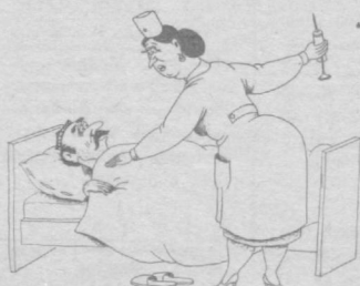
Бемор: — Илтмос кўз олдимда қайнатсангиз, «сарик» бўлиб қолмай яна.

Талъат Шомуродович АҲМЕДОВнинг бевақт вафот этганлиги мўносабати билан унинг оила аъзолари ва қариндошларига чуқур таъзия изҳор этади.