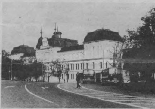
В недавнем прошлом это здание перешло от Софийской государственной типографии международному фонду имени Людмилы Живковой. Фонд открыл здесь художественную галерею, которая стала широко известна как в Болгарии, так и далеко за пределами.

Времена изменились. Имя Людмилы Живковой по понятным причинам исчезло с вывесок и из названий. А галерея так и осталась галереей. В ее восемнадцати залах представлена богатая коллекция произведений живописи различных эпох и национальных школ.