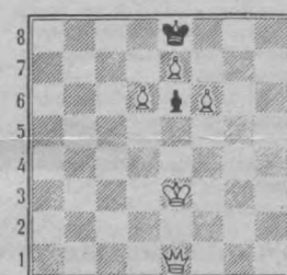
Мат в три хода. Ждем ваших писем с ответами.