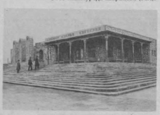
На снимке: ворота нового рынка. Через Мубарек проходит новая автомагистраль, соединяющая Узбекистан с Туркменистаном и Таджикистаном.

В промышленном городе Мубареке сдан в эксплуатацию новый современный крытый рынок. На его территории расположились магазины, торговые ларьки, предприятия бытового обслуживания. Здесь созданы все условия для дежкам, торгующих своей продукцией.