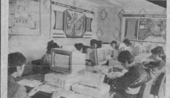
Полтора года назад Гулястанский пединститут получил статус университета. Поменялось не только название - повысилась и уровень образования. Здесь работают опытные преподаватели, кроме того, для чтения лекций ректорат постоянно приглашает специалистов из ведущих вузов Ташкента.

Жилой фонд, объекты социальности и инженерные коммуникации в сельских поселениях, в том числе в поселках Пахтабад Шариф-Рашидовского, Сардоба Ахалтинского районов, построенные во время освоения целинных земель Голодностепью "Среднеазиатского" в 60-х годах, были переданы в состав Минсельхоза в начале 70-х годов. Из-за агрессивности и высокогорного стояния грунтовых вод раннее ерочка начали выходить из строя подземные инженерные коммуникации. В связи с низкой рентабельностью целинных совхозов коммунальные эксплуатировались без периодического капитального ремонта и реконструкции. В результате тепловые и водопроводные сети быстро изнашивались. В 1985-1986 годах были предприняты меры по