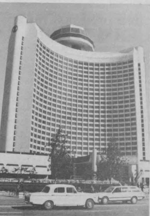
Столица Китайской Народной Республики - один из самых древних городов мира. Исторические, архитектурные памятники Пекина дают возможность совершить как бы экскурсию в минувшие эпохи, в глубь тысячелетий.