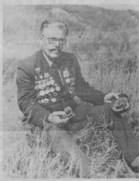
Солдат о солдате ОТ СТАЛИНГРАДА ДО ОДЕРА