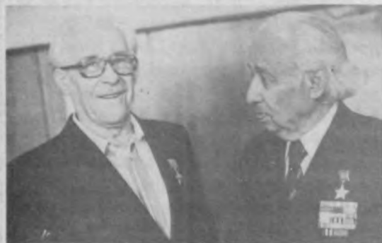
Кавалеры Золотой Звезды