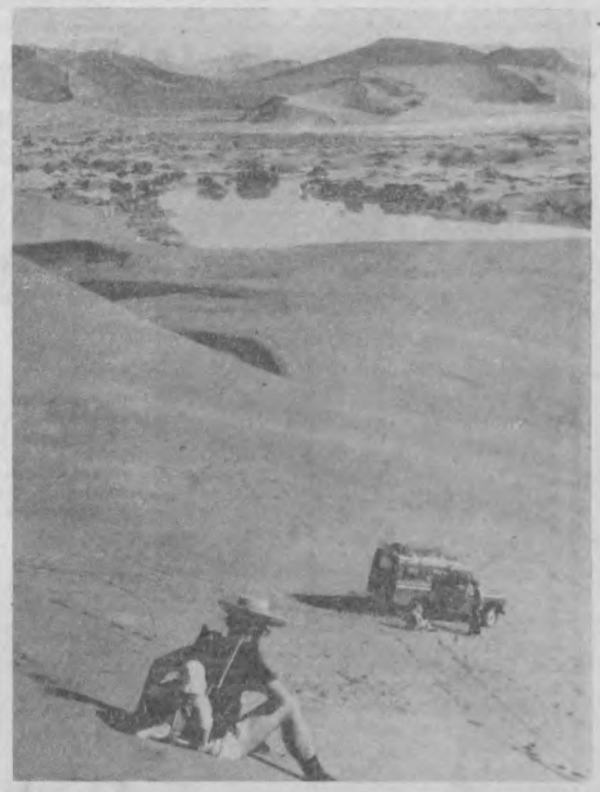
Намибия - одна из живописнейших стран, известная своими редкими природными феноменами. На снимке: Сосульевская впадина. Она знаменита тем, что в ней образуются самые высокие в мире песчаные дюны. Их высота достигает трехсот метров. Выглядит впадина, как пустыня. Однако время от времени река Тслучав затопляет глинистые участки водой - и в пустыне образуются небольшие озера с растительностью.